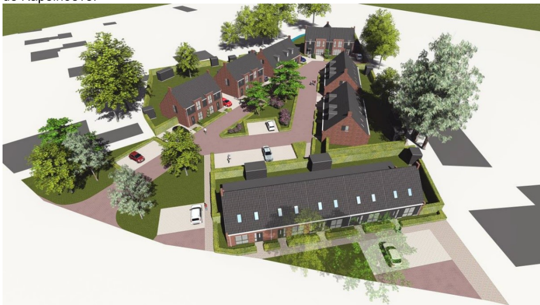
Fig. 1 Impressie van het nieuwbouwplan 'Hems Hoeve'

Afgelopen week zijn in Netersel opgravingen begonnen op het voormalige terrein van vleesverwerker Hems aan De Hoeve 22. Hier wordt binnenkort nieuwbouw gerealiseerd voor het nieuwbouwplan 'Hems Hoeve' Netersel (zie fig. 1). Maar voordat het zover is, wordt eerst gezocht naar sporen van de oude Kapelhoeve of Grootte Hoeve die tot 1648 toebehoorde aan de abdij van Postel. Deze hoeve hoorde al vanaf de 14 e eeuw bij het naast gelegen burchtterrein met Stenen Huys en kapel. Dit gehele omgrachte gebied is de kern van het oorspronkelijk middeleeuwse Netersel. De langgevelboerderij die hier tot voor kort stond en dateerde uit 1956 is precies gesitueerd op de oudere bebouwing die op de kaart van 1832 zichtbaar is (zie fig. 2) en die deel uitmaakte van de Kapelhoeve.