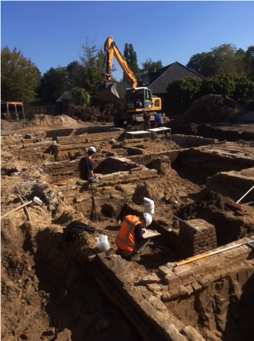
Fig. 3 Muurfunderingen van de oude Groote Hoeve tijdens de opgraving door Archol.

Het archeologisch onderzoek wordt uitgevoerd door Archol uit Leiden en zal tot uiterlijk eind september duren. Zij werken hierin samen met Baetsen die het sloopwerk op het terrein verzorgt. Uit het archeologisch onderzoek blijkt dat direct onder de betonvloeren van de gesloopte boerderij uit 1956 nog volop oude funderingsmuren, kelders en mestputten aanwezig waren. De veelvuldig hergebruikte oude stenen in de funderingen dateren zeker tot in de 17 e eeuw. Opvallend is de diepte van de funderingen die soms wel tot een meter reikte. Dit lijkt hier samen te hangen met de aanwezigheid van de omgrachting van het burchtterrein dat dwars over het terrein liep vanaf De Hoeve naar het noorden. Hier ligt ook nu nog een deel van de bestaande gracht die doorloopt naar het oude kapelterrein. De boerderij aan De Hoeve 22 was dan ook over deze gracht heen gebouwd. Er werd bij één van de funderingsmuren zelfs een aanzet van een spaarboog gevonden, een bouwwijze die je eigenlijk alleen bij kastelen en vestingwerken tegenkomt. Deze en komende week zal duidelijk worden hoe de omgrachting van het burchtterrein hier verloopt en of er onder de oude boerderij maar ook daarbuiten nog middeleeuwse sporen aanwezig zijn.